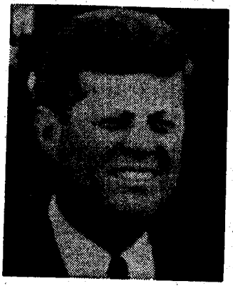
JOHN F. KENNEDY