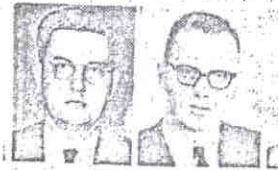
Вот они, иностранные разведчики, маскировавшие под дипломатов и коммерсантов: Родной Карлсон, Гревилл Винн, Хью Монтгомери, Ричард Дажоб, Роберт Джарман.

Закончилась первая половина декабря, а на европейской территории СССР почти повсюду очень тепло. Температура воздуха на 4—6, а местами даже на 10—12 градусов выше многолетней средней. Дожди уступают место мокрому снегу. На побережье Черного моря были отмечены даже грозы. А вот снегопады наблюдались в Восточной Грузии, Армении и Азербайджане. Холодная погода удерживается в большинстве районов Средней Азии. Морозы до 25—30 градусов и малооблачная погода в Казахстане. На огромных просторах Сибири ясные морозные дни сменяются снегопадами, сильными ветрами и метелями.