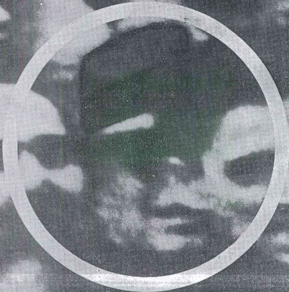
l'uomo col cappello e gli occhiali neri al centro del cerchio sarebbe la spia George De Mohrenschildt che, secondo la sua dichiarazione alla commissione Warren, quel giorno si sarebbe trovato ad Haiti. L'asterisco indica l'uomo che quasi sicuramente è Ruby. Il negativo di questa eccezionale foto — selezionata fra migliaia e migliaia — è in possesso di uno sconosciuto che ne ignora l'importanza