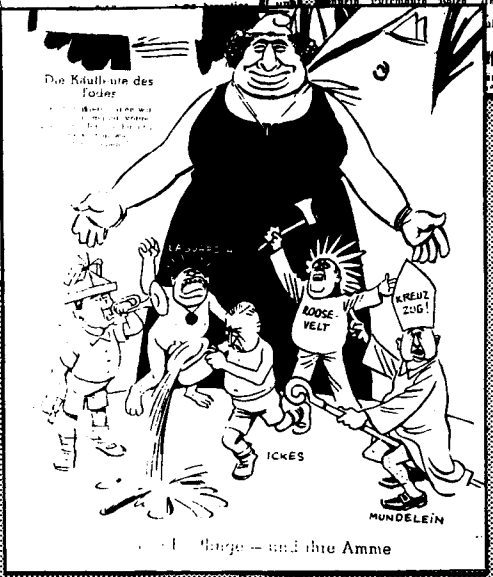
Die Kultur und des Führer