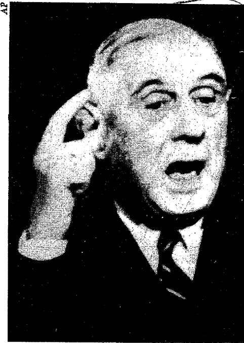
De Gaulle le pone trabas a Inglaterra

Kennedy, justificadas o no, tienden a menmar el prestigio del presidente del Tribunal Supremo, Earl Warren, que presidió la Comisión y el del gobierno mismo del presidente Johnson. La actitud de Johnson parece flexible. Su secretario de Prensa, Bill Moyers, recordó a los periodistas que Johnson había dicho con anterioridad que estaba seguro de que si se advertía indicio alguno que suscitara dudas en el ánimo de cualquier persona razonable sobre las conclusiones del informe, "la Comisión y las autoridades apropiadas adoptarían el curso de acción que pudiera estar justificado." Tal vez esté llegando ahora el momento en que pueda ocurrir tal cosa.