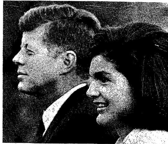
Los Kennedy: a los tres años, dudas