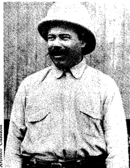
Francisco Villa: en caracteres de oro

Pero un columnista de El Universal , Díaz Ruanova, coincidió con la opinión de muchos cuando anotó: "Villa es leyenda deslumbrante y fama internacional que no han alcanzado figuras más nobles y diamantinas de la Revolución Mexicana como Madero y Zapata, por ejemplo. La razón es clara. En Villa se reúnen, muy contrastados, los rasgos positivos y negativos del revolucionario mexicano."