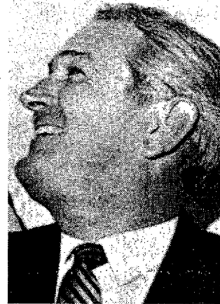
Connally: entre medio y 1,3 segundos