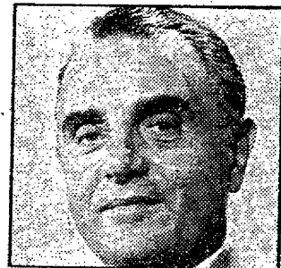
George de Mohrenschildt – skød sig eller blev skudt