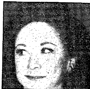
Dorothy Kilgallen – død – mystiske omstændigheder