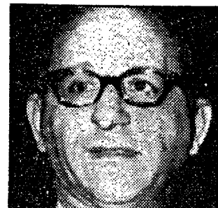
Sam Giancana – dræbt med syv skud i sin kælder