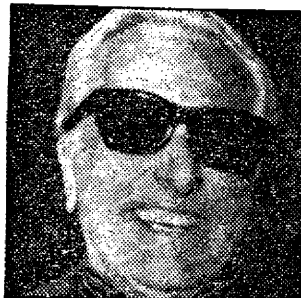
John Roselli – myrdet, viklet ind i kæder i havet