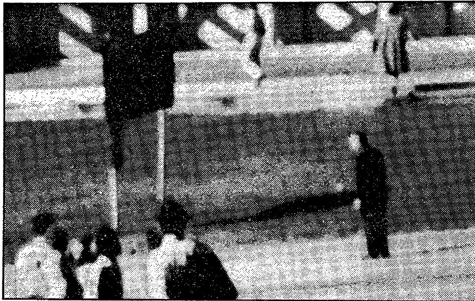
Ca. 20 sekunder senere: »Paraplymanden« rejser sig fra kantstenen og forlader mordstedet i retning mod skolebogslageret. Her står han med paraplyen i venstre hånd og kikker ned mod jernbaneviadukten og efter »Cubaneren«, som er gået i den modsatte retning af »Paraplymanden«.

»Den anden mystiske person kalder jeg »Cubaneren«. Det er ikke for at antyde en cubansk forbindelse til mordet,« fortsætter Jack White, »men det kalder mange ham, fordi han har et cu-