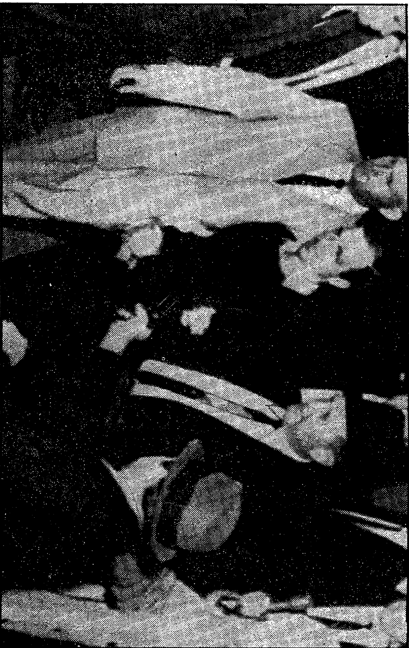
Kældereren under politistationen. Jack Ruby træder frem med en revolver i højre hånd. I næste øjeblik trykker han på aftrækkeren. Hverken Oswald eller de to politifolk har opdaget Ruby.