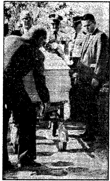
Her bliver Oswald bragt til kapellet på kirkegården i Fort Worth mandag den 25. november.