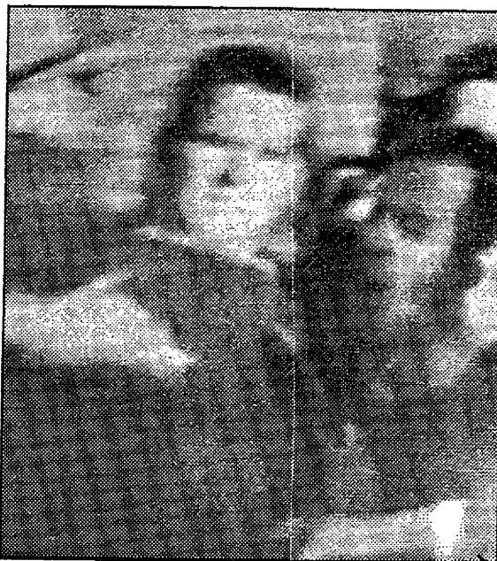
Oswald skriger af smerte, og hans ansigt trækker sig sammen. Kort efter falder han sammen, og politifolk overmander Jack Ruby og kaster ham til jorden.

Og herefter startede Warren-kommissionen så sit felttog for at bevise, at denne mand, som ikke længere kunne forsvare sig, og som aldrig nåede at få en sagfører, var skyld i mordet på en af verdens mægtigste mænd. Jack Ruby blev dømt for overlagt mord på Oswald. Hans egen begrundelse for ugerningen var, at han ville skåne Jacqueline Kennedy for at vidne i en retssag mod Oswald.