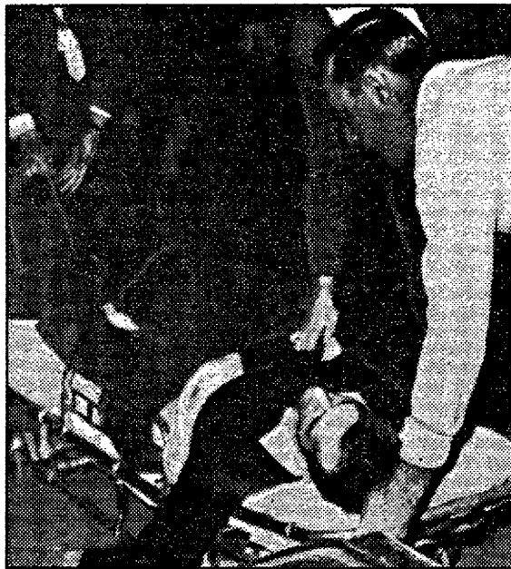
Politichef Jesse Curry havde sørget for, at en ambulance holdt parat udenfor politistationen, hvis der skulle ske noget. Her er Oswald anbragt på en bære og blev straks efter bragt til Parkland hospitalet, hvor han døde kort efter.