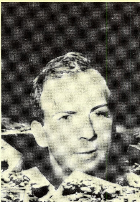
Oswald: man in regenjas

„Omdat ik Nosenko al ondervraagd had. Angleton wist dat Nosenko niet met me gepraat zou hebben, tenzij de CIA hem zelf gestuurd had, aangezien Nosenko voor de CIA werkte. Angleton, die door Colby bij de CIA ontslagen was, wilde weten waarom de