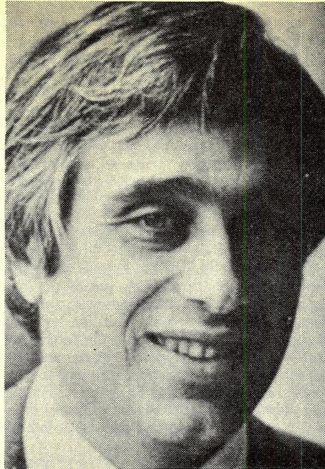
Epstein: 74 nieuwe getuigen

„Powers werd in mei neergeschoten — ongeveer zes maanden nadat Oswald naar de Sovjet-Unie was overgelopen. Hij werd ongeveer zes maanden lang door de Russen ondervraagd en hij herinnerde zich dat hem ontzettend veel vragen gesteld werden over de luchtbasis Atsugi, over andere piloten van die basis en over de vlieghoogte en de speciale kenmerken van het vliegtuig. Powers vertelde me dat hij vermoedde dat een