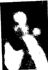
Lee Oswald afirmou que sua fotografia, de fuzil em punho, estava adulterada: sua cabeça fora colocada sobre outro corpo. No momento do primeiro tiro, um homem muito parecido com Oswald estava na porta do Depósito de Livros.