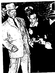
Com Lee Oswald morreu também a possibilidade de se chegar depressa à verdade final.

A opinião de alguns dos maiores estudiosos no assunto é confrontada com o Relatório Warren.