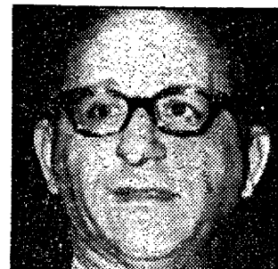
Sam Giancana – dræbt med syv skud i sin kælder