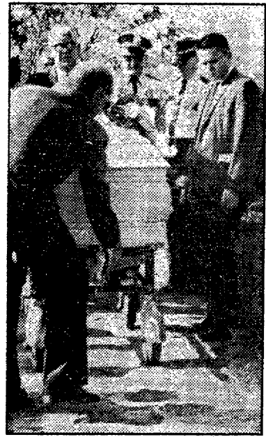
Her bliver Oswald bragt til kapellet på kirtegården i Fort Worth mandag den 25. november.