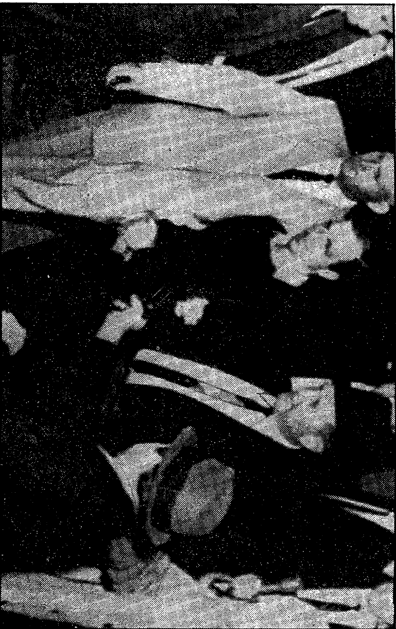
Kældereren under politistationen. Jack Ruby træder frem med en revolver i højre hånd. I næste øjeblik trykker han på aftrækkeren. Hverken Oswald eller de to politifolk har opdaget Ruby.