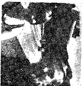
AF ANNELISE PEDERSEN PER U. RIEPER-HOLM