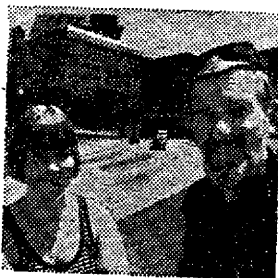
AF ANNELISE PEDERSEN PER U. RIEPER-HOLM

hævder, at denne mand var Oswald. I de følgende minutter strømmede politibiler til. Flere vidner kunne give oplysninger, der førte til, at Oswald blev anholdt i Texas Theatre biografen på West Jefferson Street.