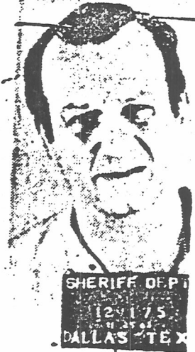
Jack Ruby, asesino de Oswald.

EN los Estados Unidos el libro no ha producido el mismo impacto popular que en Europa, si bien la crítica se ocupa bastante de él, coincidiendo, en términos muy parecidos, en que comprende "una extraña amalgama de verosimilitud y propaganda". A nuestro criterio, y aparte cualquier interés político que persiga el autor, se trata de un libro bien logrado en prosa narrativa. Atrae al lector e im-