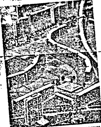
Дома поворачиваются к солнцу.

Новый жилой район полностью вступит в строй к 1970 году, а первая жилая в этом времени будет у нас 12 квадратных метров на человека. Квартиры должны строиться так, чтобы у каждой плена семьи была отдельная комната.