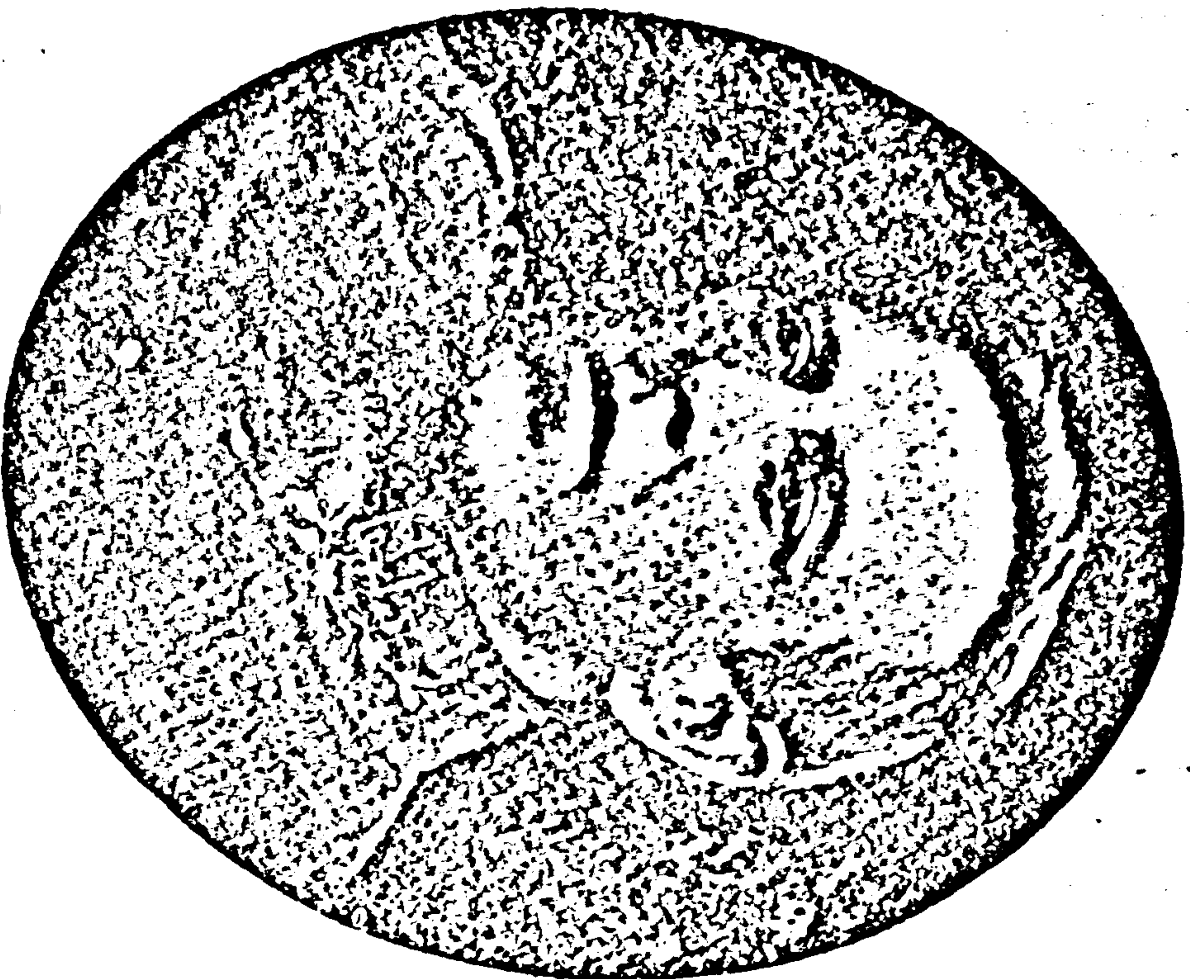
Результат Отчужд С. В. Петлюра