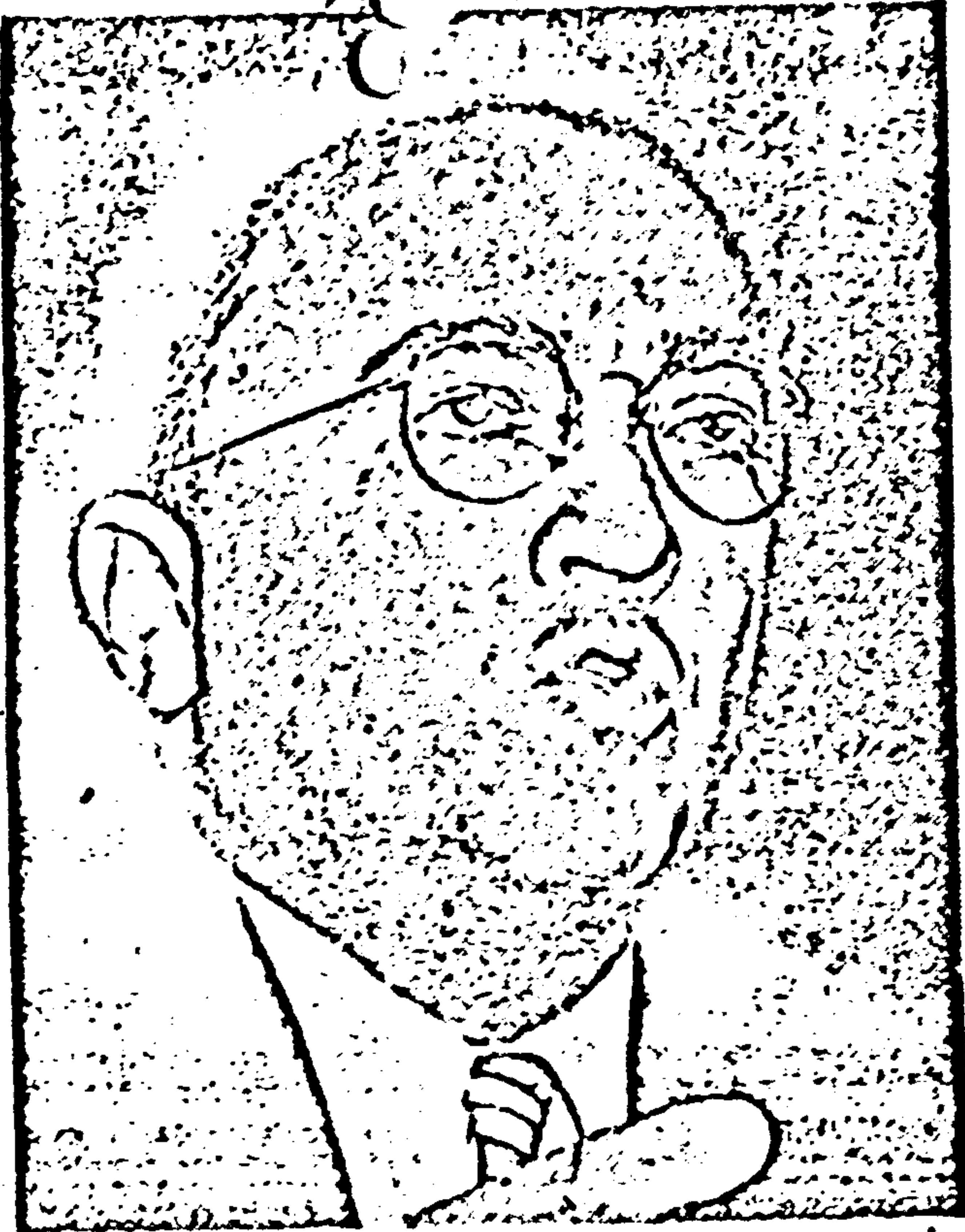
Edgar J. Hoover