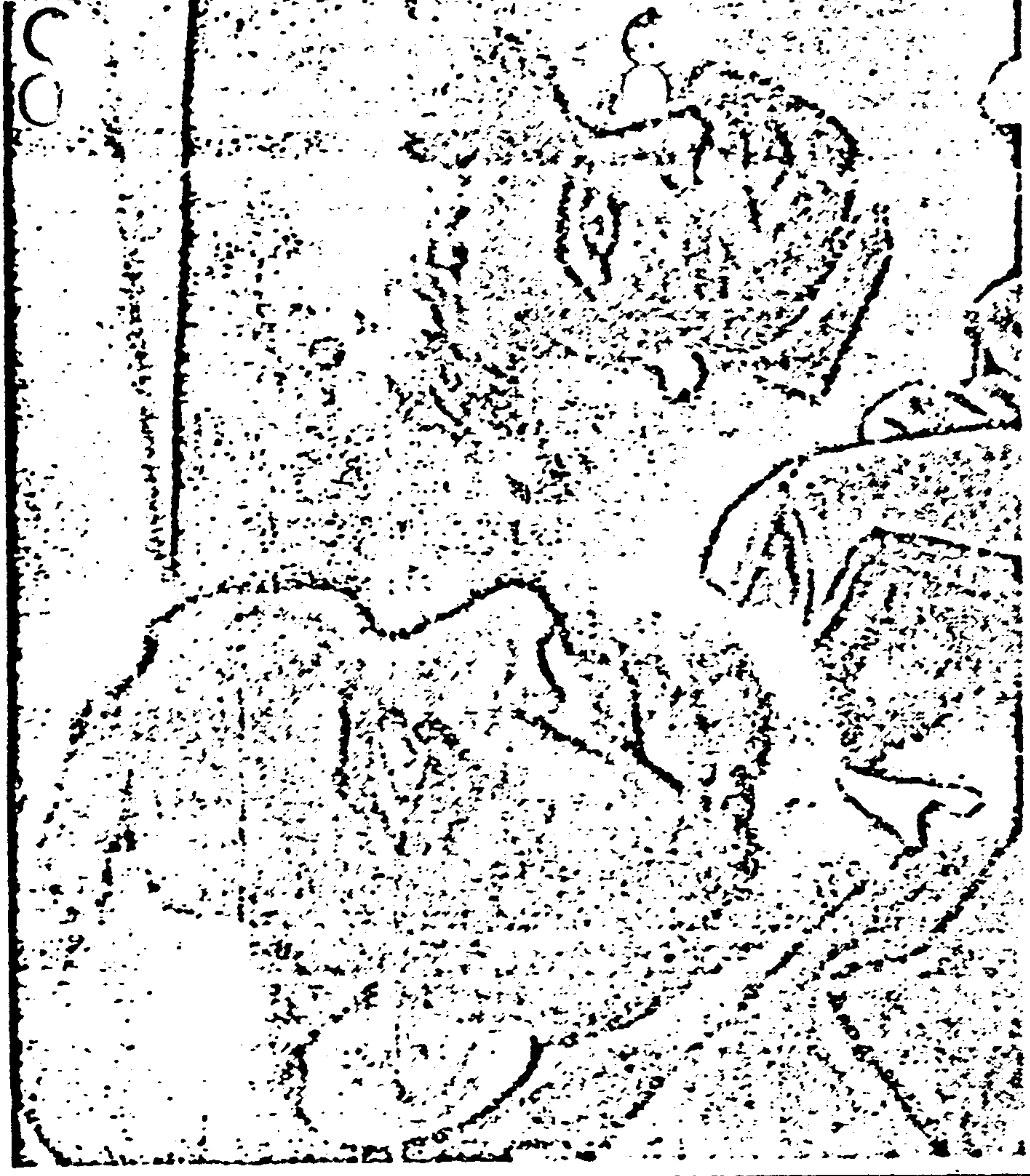
Marina Oswald si reca a deporre davanti alla Commissione d'inchiesta

Il Supremo magistrato Earl Warren che presiede la Commissione dinanzi alla quale è comparsa la moglie del presunto assassino del Presidente ha dichiarato che la deposizione non sarà divulgata almeno durante la nostra generazione