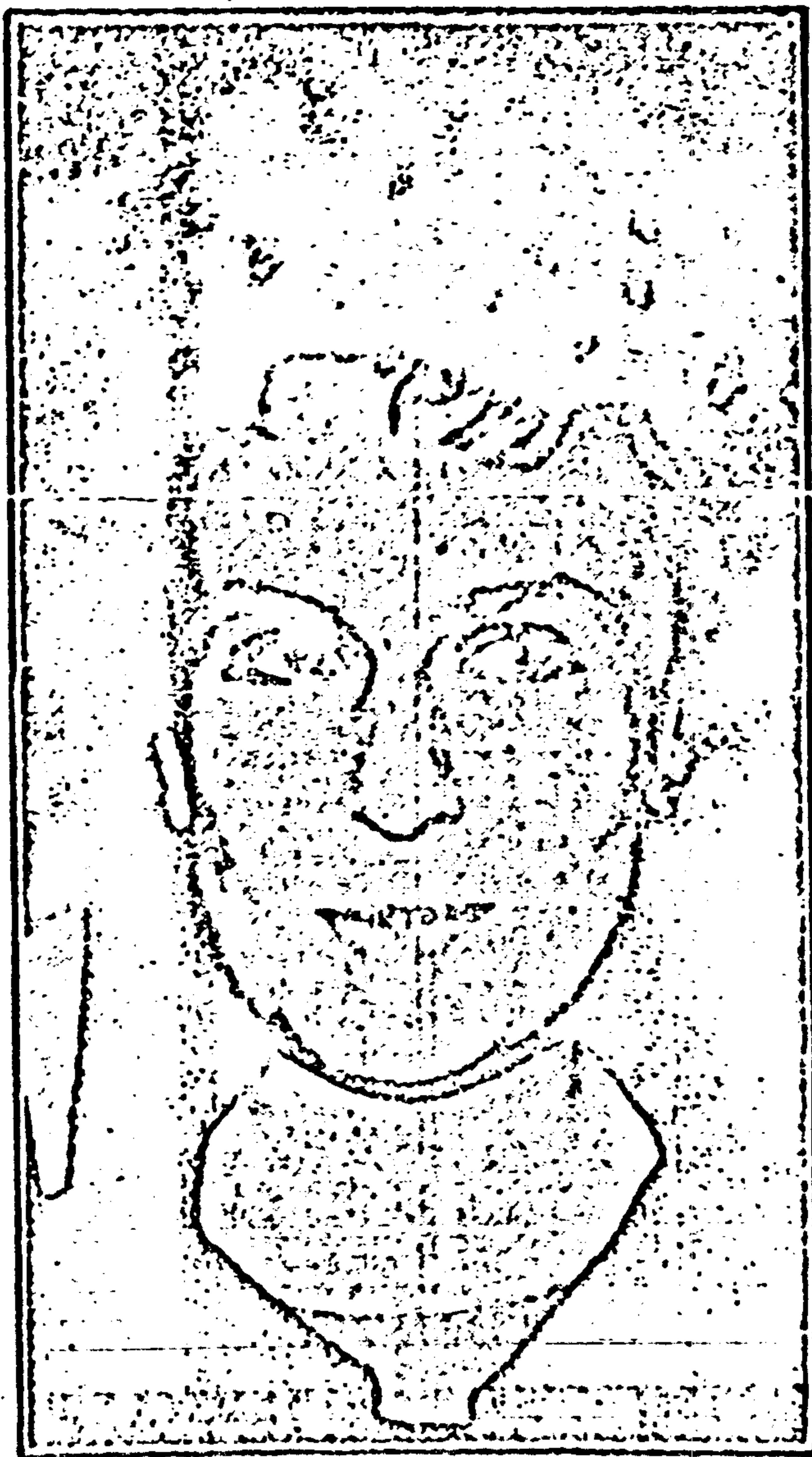
WASHINGTON — Marina Oswald dopo l'interrogatorio

La ricostruzione delle circostanze che hanno preceduto e seguito l'assassinio di Kennedy è infatti giudicata, generalmente, piuttosto lacunosa. Si ha l'impressione che le ragioni che hanno spinto Jack Rubenstein ad uccidere Oswald siano meno complesse dal punto di vista psicologico di quelle spiegate ufficialmente, e siano quindi anche più attendibili dal punto di vista della logica. A questo riguardo si mette in rilievo negli ambienti giornalistici americani che «Ruby» potrebbe